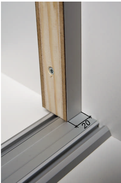
Abb. 1 Montage der Grundleiste an die Wand

Sie können damit division Gleittüranlagen auf einfache Weise, optisch ansprechend, an unebene oder schiefe Wände anpassen.