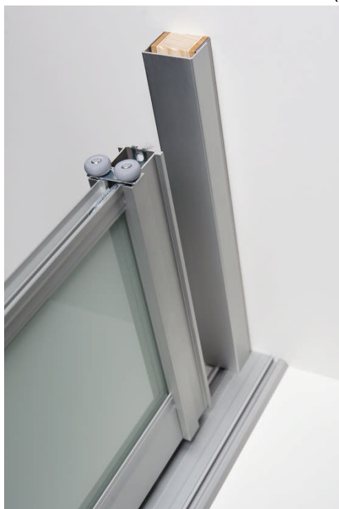
Abb. 3 Breitenausgleich fertig montiert

Sie haben nun für Ihre division Gleittüren einen geraden und senkrechten Wandanschluß (Abb. 3). Die Türen werden durch die mitgelieferte Anschlagbüste angenehm gedämpft.